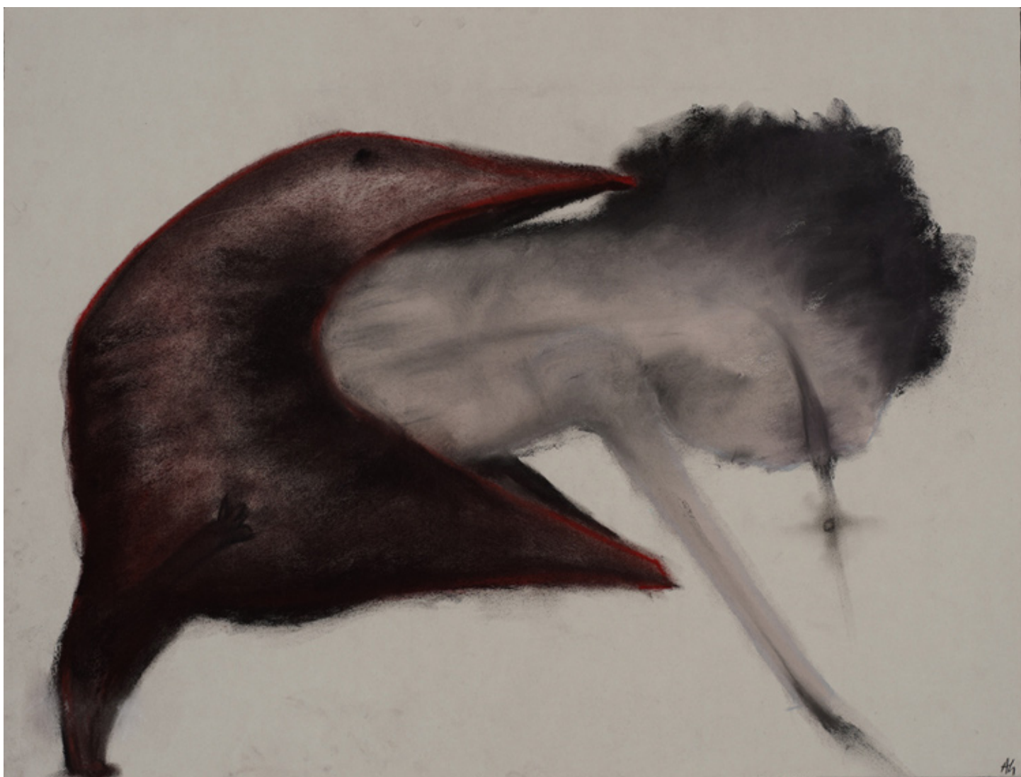
“Sans titre” Pastel sur papier 48x64cm