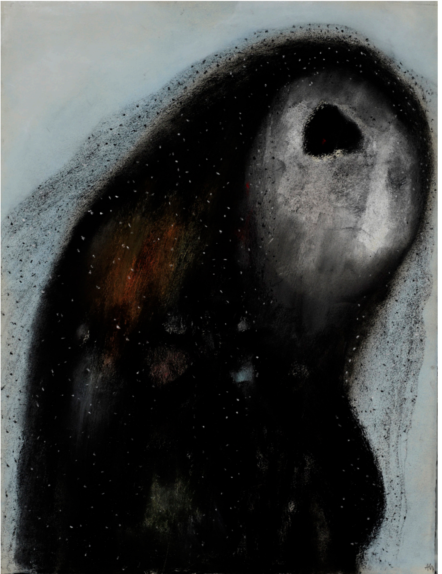
“Sans titre” Pastel sur papier 63,5x48,5cm