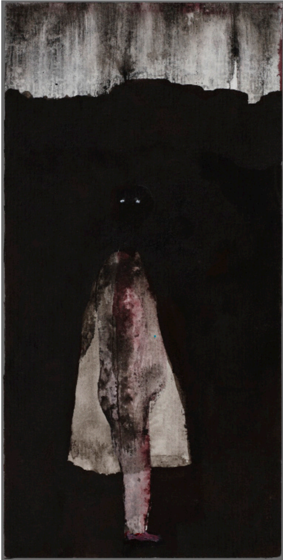
“Sans titre” encre de chine sur papier 20,5x10,5cm