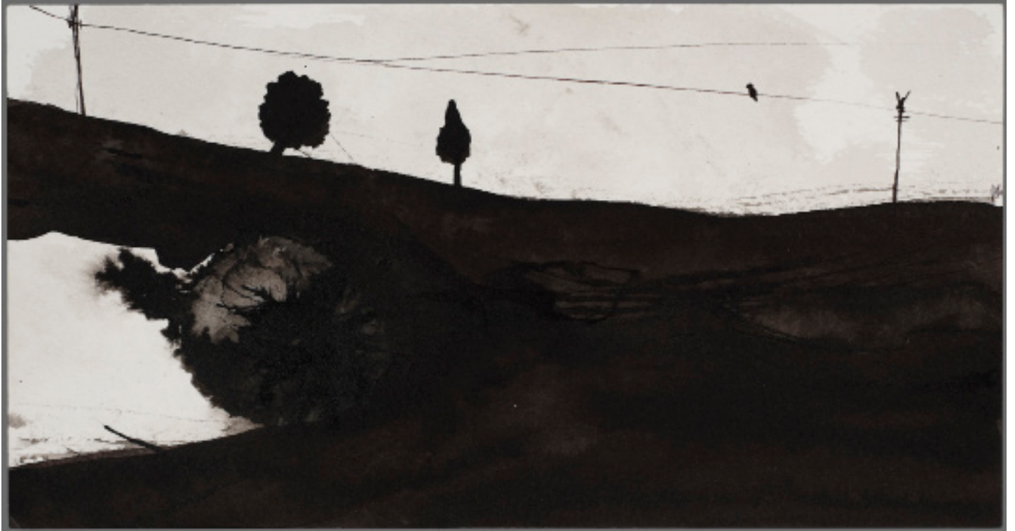
“Sans titre” encre de chine sur papier 12x23cm