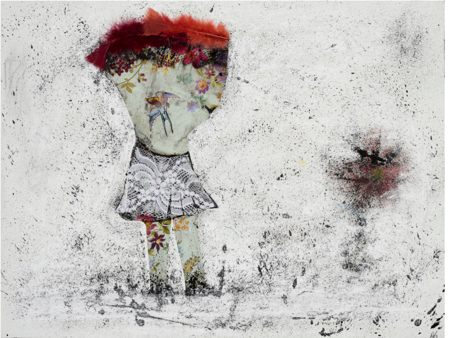
“Sans titre” technique mixte sur papier ( encre et collage: dentelle, plumes, papier cadeau) 64x48,5cm