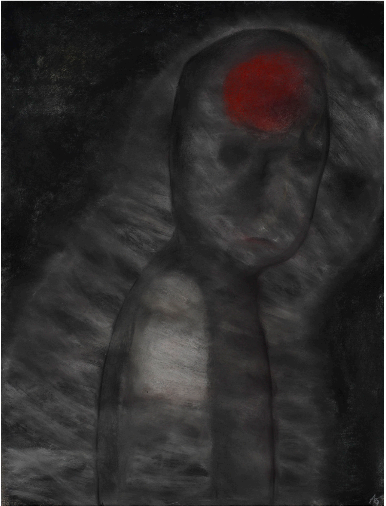
“Sans titre” Pastel sur papier 63,5x48,5cm